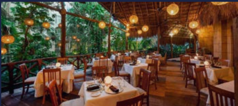
BAR - RISTORANTE