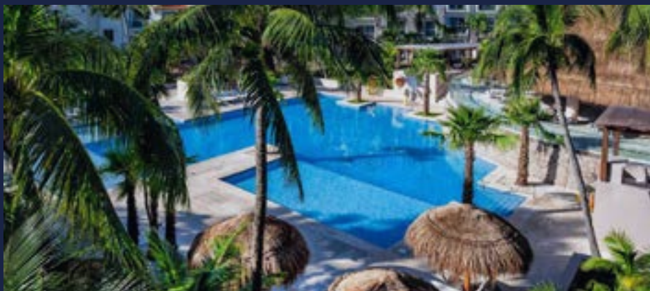
SPIAGGA E PISCINA